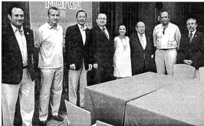
El alcalde y el concejal de Sanidad, con los representantes de los enfermeros.

Cámara recibe el reconocimiento de los enfermeros